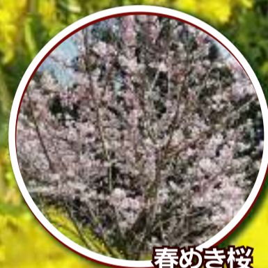
春めき桜 3月中旬～3月下旬