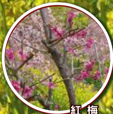
紅梅 2月上旬～2月下旬