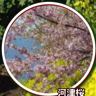
河津桜 2月上旬～3月上旬