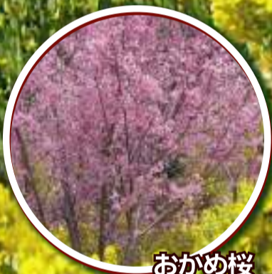
おかめ桜 3月上旬～3月中旬