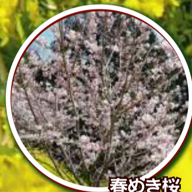
春めき桜 3月中旬～3月下旬