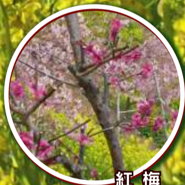
紅梅 2月上旬～2月下旬